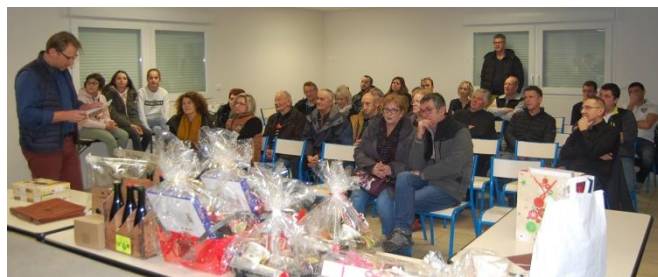
L'attribution des lots le 11 Janvier

Après le tirage, gagnants et artisans/commerçants se sont rassemblés pour partager petits fours et verre de l'amitié pour terminer cette soirée placée sous le signe de la bonne humeur et de la convivialité. !