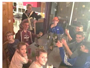
Les conscrits à l'œuvre... et en musique