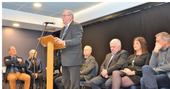
Les Elus lors des vœux de la communauté de communes...

Et voilà... C'est terminé pour les vœux 2018 !