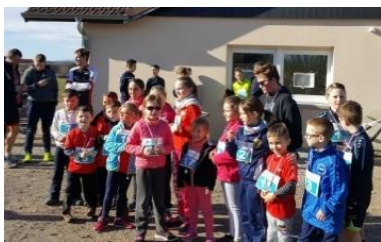
Beaucoup de coureur en début de saison...