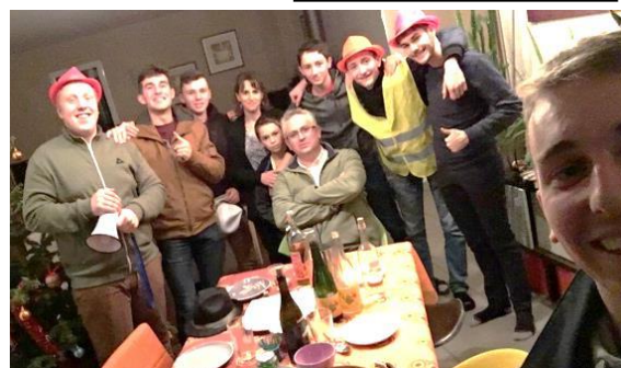
Les conscrits prenant la pause... mais pas en pause !