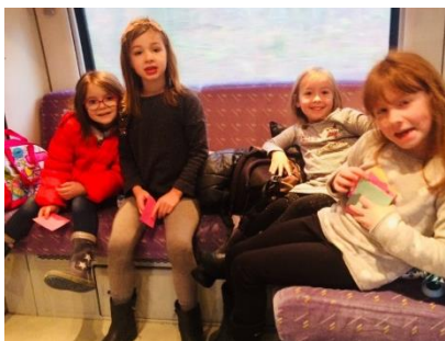
Les enfants dans le train... .. et à table !

Comité des Fêtes Charbonnières les Sapins