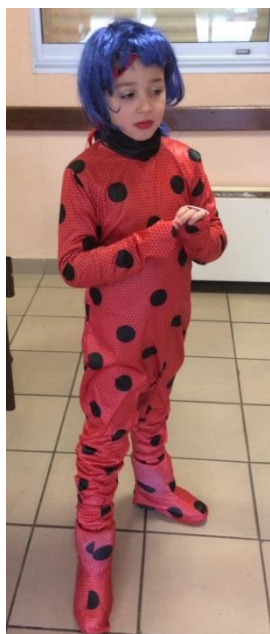
Des beaux déguisements bien colorés malgré la grisaille de la météo.

Enfin, chacun a pu repartir avec une part du butin : un gros sachet de friandises !