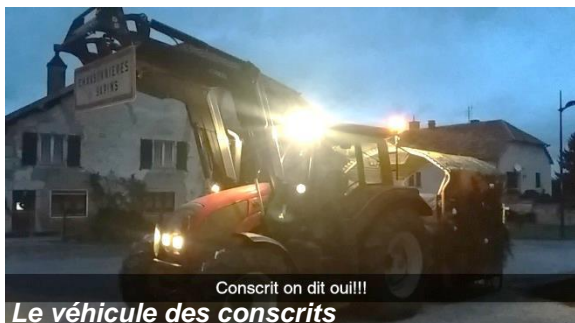
Conscrit on dit ou!!!!

La nouvelle génération (années de naissance 1997-2001) s'était essayée l'année dernière en allant souhaiter la bonne année dans quelques maisons. Mais 2018 a sonné leur retour de manière beaucoup plus soutenue, et avec une organisation peaufinée : tout d'abord un petit mot dans les boîtes aux lettres pour avertir les habitants de leur passage, et ainsi se faire inviter plus facilement à manger... si bien qu'ils ont été conviés chaque soir de la première semaine.